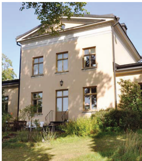
Dockmästarbostaden är ritad av arkitekten är Axel Kumlien. Byggnaden är i dag privatbostad.

⑥ Bakom ryggen kan du se en avvikande stenbyggnad. Denna nyklassicistiska byggnad från 1871 är dockmästarbostaden, även kallad Stenvillan, som var en representativ bostad med kontor för den som ledde arbetet i dockorna - dockmästaren.