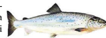
Lax Salmo salar

Som kuriosa kan nämnas att ibland "fastnar" laxar och andra fiskar i dockorna och torrläggs tillsammans med båtarna i dockorna.