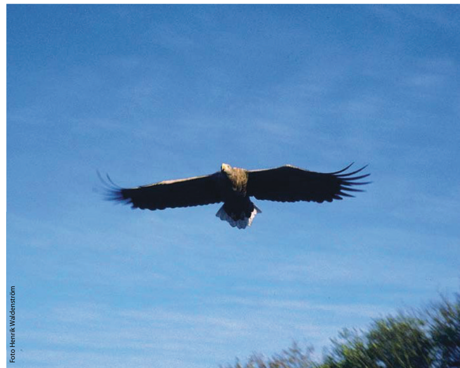
Havsörnen är Sveriges största rovfågel och kan ses över Beckholmen, särskilt vintertid.

Fågellivet är mest spännande utanför och i luftrummet ovanför Beckholmen. Utanför dockorna fiskar ofta storskarvar (svarta och gås-liknande). Dessa fåglar har ökat starkt i Stockholms skärgård och ses regelbundet i Saltsjön. De jagas av havsörnar som också ökat och under vinterhalvåret flyger de ofta över Beckholmen. På sommarhalvåret är det den svartvingade silltruten som är värd att notera när den dagligen flyger över. Den minskar i östersjöområdet men har fortfarande ett starkt fäste i Stockholm, särskilt på Fjäderholmarna.